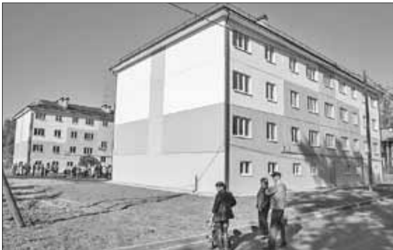
■ Новые дома на улице Вычегодской