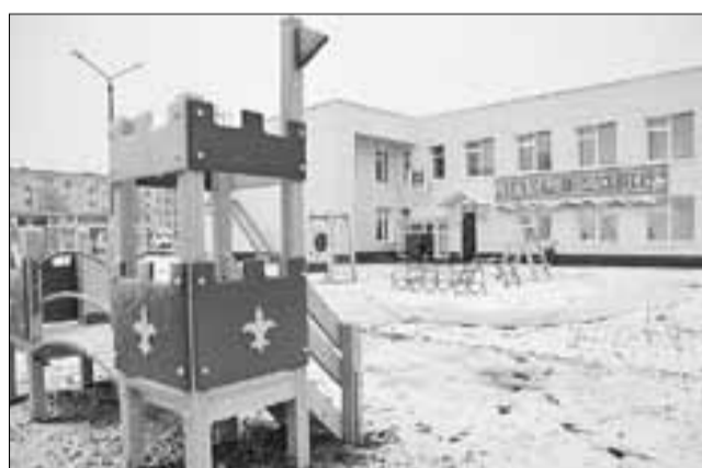
■ Детский сад «Почемучка»

Предполагается, что здесь будут проходить уроки физкультуры, есть чем заняться и во внеурочное время – летом футбол, зимой – хоккей.