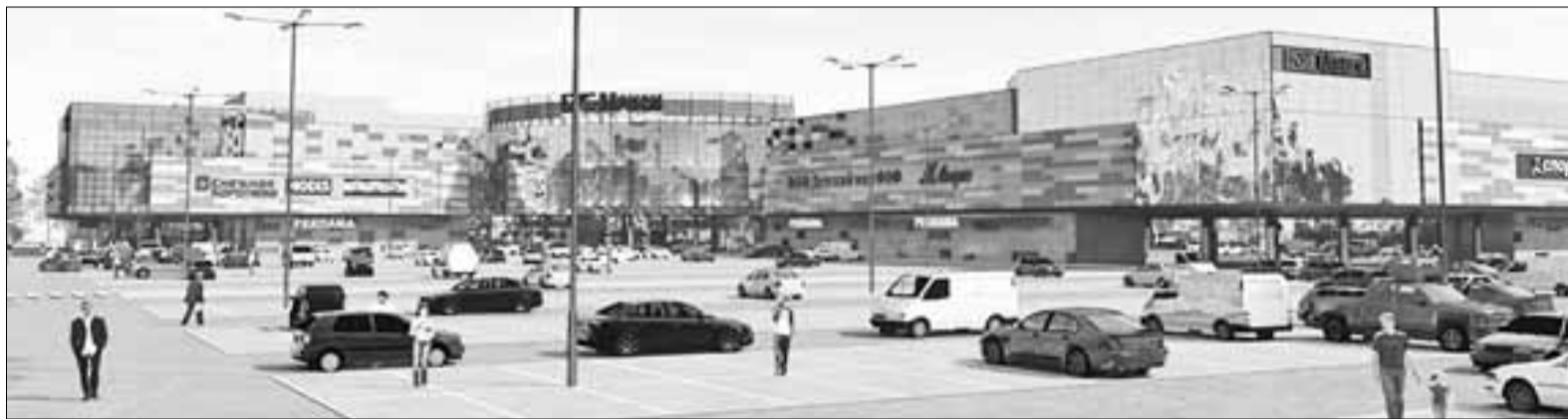
■ Так будет выглядеть торгово-развлекательный комплекс, который возводится вдоль Ленинградского проспекта