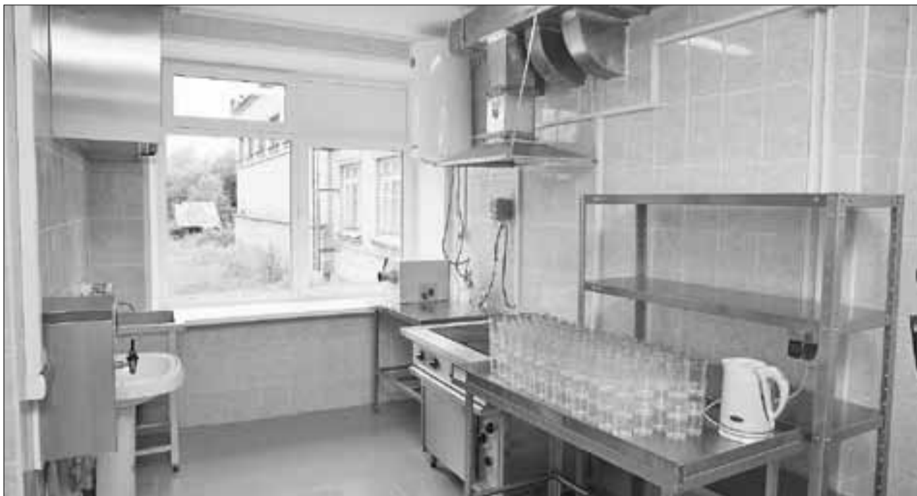
■ В школьной столовой на Хабарке есть все – от новой вентиляции до современного кухонного оборудования