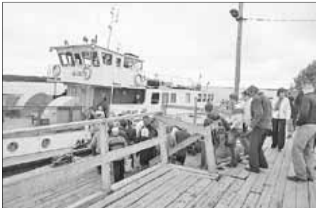
■ Причал на острове Хабарка