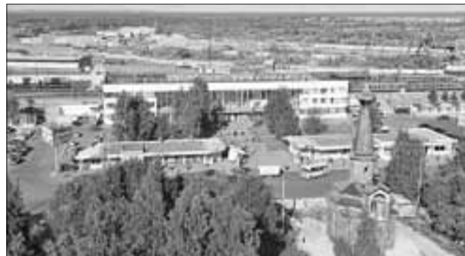
■ На площади перед железнодорожным вокзалом построена церковь