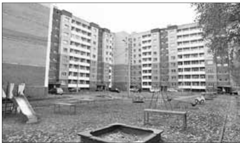
■ Дом на улице 40 лет Великой Победы был построен для переселения людей из ветхого жилья