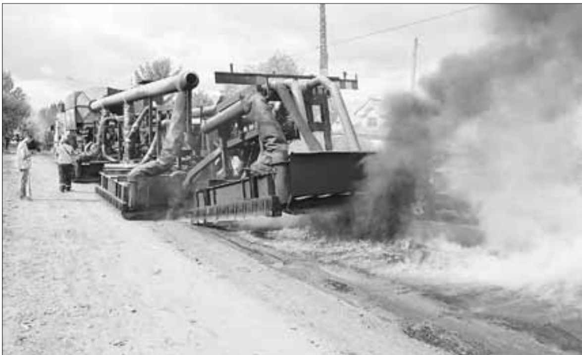
■ Дорожный ремонт на Ленинградском проспекте в 2013 году проводили с применением самых современных технологий