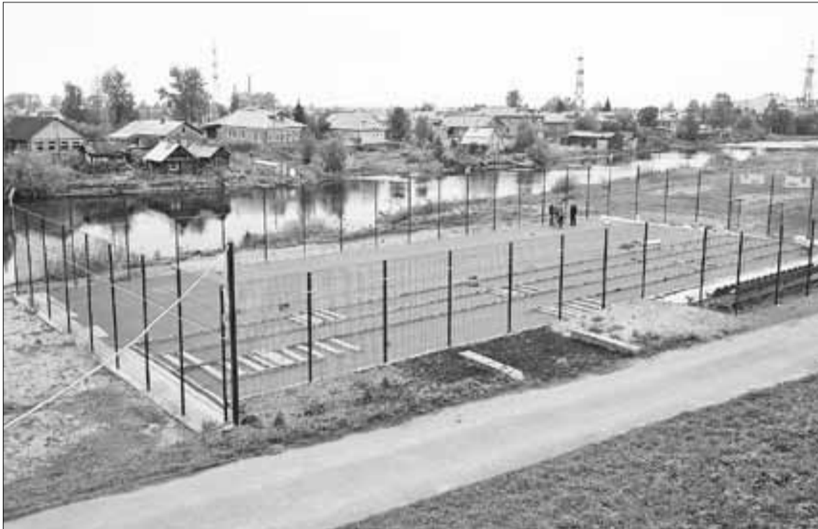
■ Инфраструктура Исакогорского ДЮЦ дает все возможности для занятий спортом