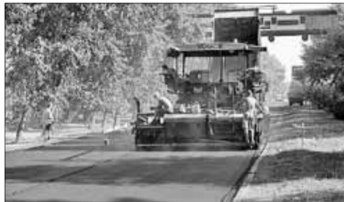
■ Ремонт улицы Гагарина