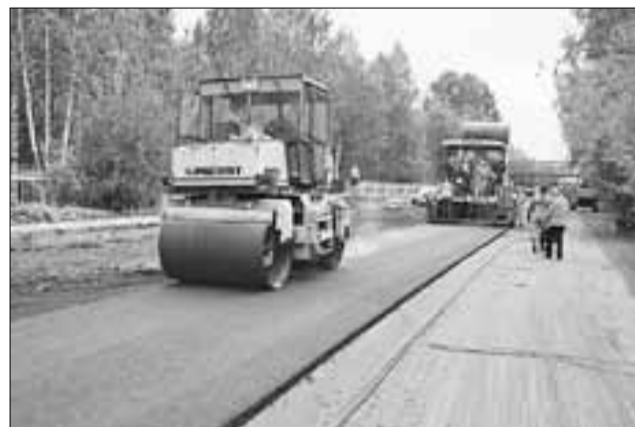
■ Одним из важных объектов дорожного ремонта нынешним летом стала улица Ярославская

« Все, что нужно для столовой, школа получила по городской программе модернизации школьного питания