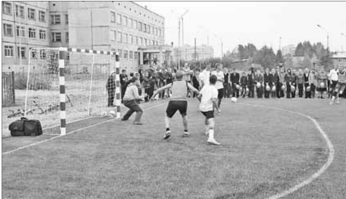
■ На территории школы № 59 обустроили современное футбольное поле

Отдохнуть душой, а заодно и прочесть последние новинки ли-