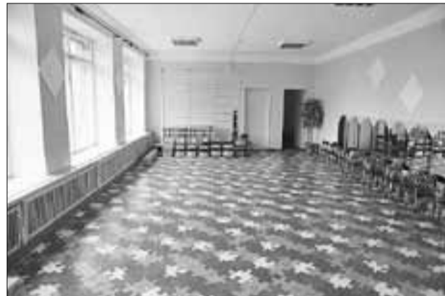
■ В школе-саду № 98 сделан косметический ремонт