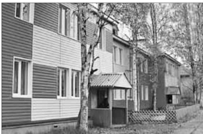
■ Дом на Квартальной, 7