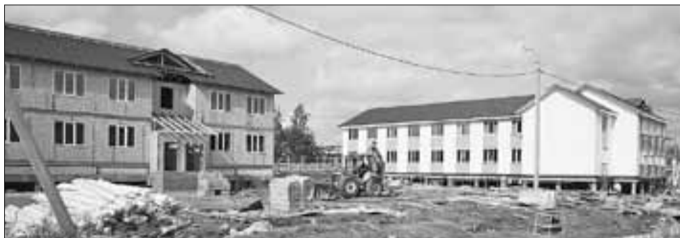
■ На Конзихинской улице скоро появится целый микрорайон