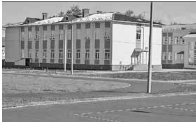
■ Новое здание школы № 69

Переворужение предприятия даст дополнительный импульс развитию округа. Там, где есть такие инвестиции в производство, будет развиваться и инфраструктура округа – строятся жилье и объекты социальной сферы. Планы муниципалитета по возведению жилья не обошли стороной Цигломенский округ. Подтверждением тому является начало строительства нового жилого микрорайона. В округе около 800 жилых домов признаны аварийными.