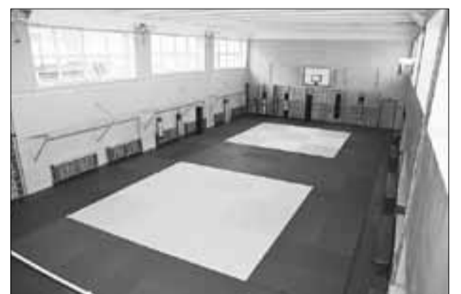
■ Спортзал ДЮСШ «Каскад»