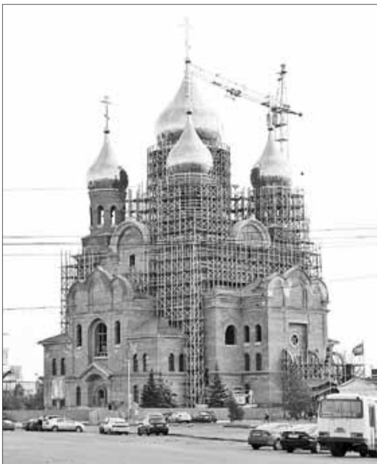
■ Михаило-Архангельский кафедральный собор уже стал одним из символов города

Улицу Выучейского люди называют дорогой к храму или дорогой дружбы. Все потому, что она свя-