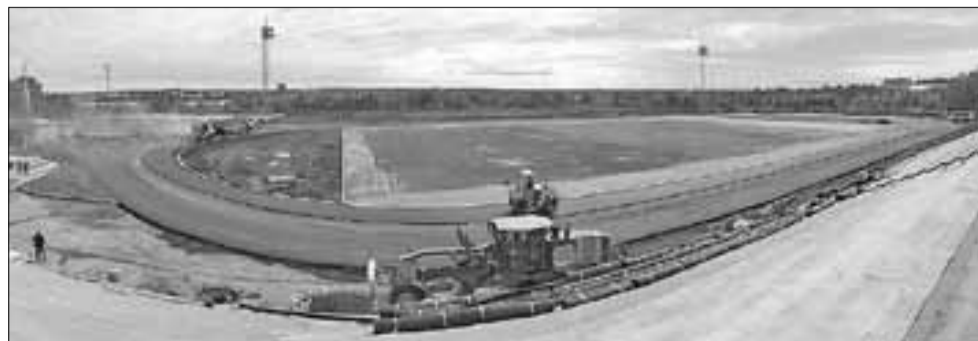
■ Реконструкция стадиона ДЮСШ № 6