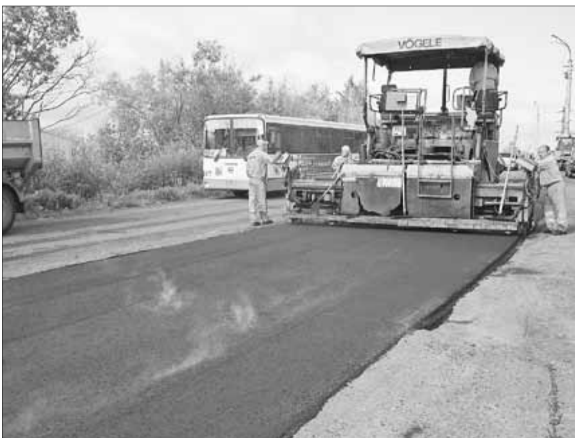
■ Свежий асфальт на улице Мостовой

В Северном округе обновляются дороги: этим летом был проведен ремонт автополотна на улицах Кировская и Мостовая. Последний раз они модернизировались в 2006 году по городской программе ремонта дорог. В общей сложности в 2014 году будет приведено в порядок более пяти тысяч квадратных метров дорожного полотна.