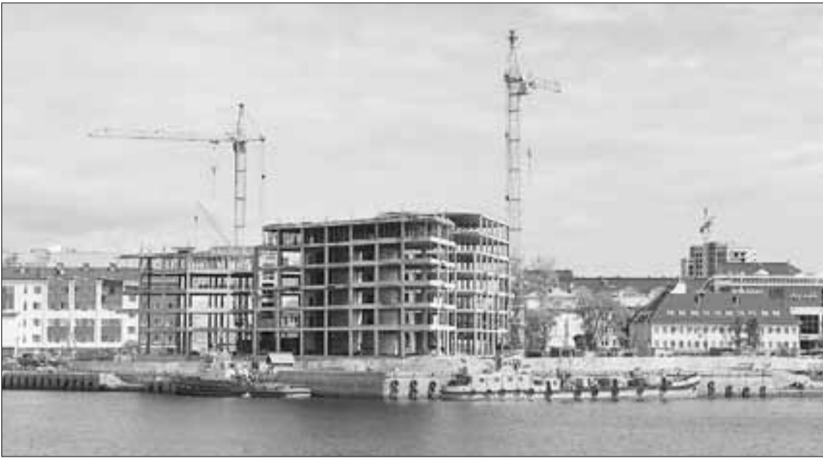
■ На набережной идет масштабная реконструкция, совсем скоро она преобразится до неузнаваемости