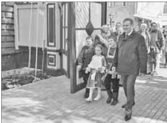
■ Открытие дома северной культуры «Архангелогородская сказка»