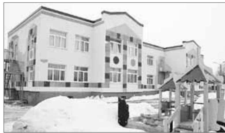
■ Детский сад на улице Добролюбова принял первых воспитанников в начале марта