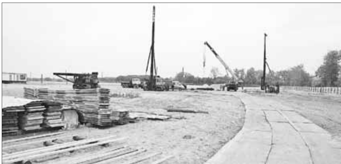
■ Стройплощадка на улице Цигломенской, где начинается возведение социальных домов