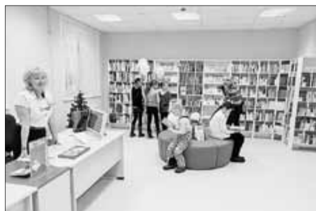
■ Новая библиотека на улице Победы