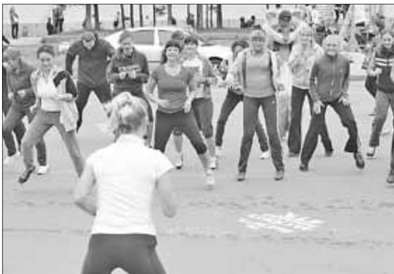
■ Молодежь с удовольствием участвует в мероприятиях, пропагандирующих здоровый образ жизни