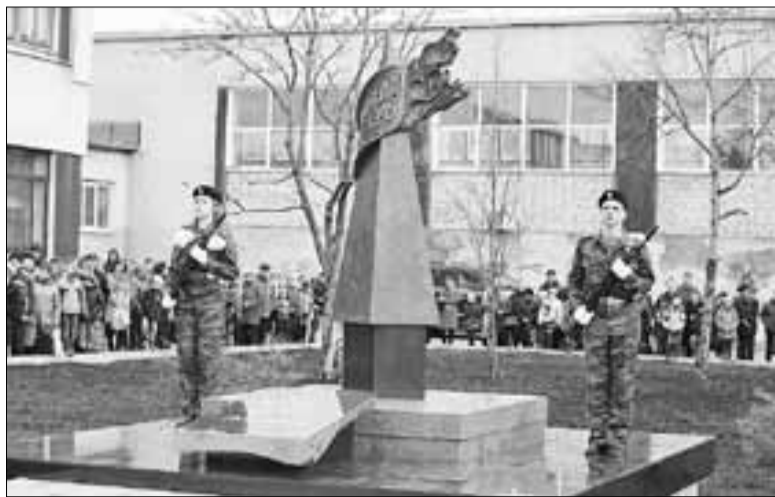
■ На улице Никитова открыта стела Победы

Укладка нового дорожного покрытия была только началом большого проекта мэрии по капитальному ремонту и реконструкции магистрали от Окружного шоссе до границы с Приморским районом .