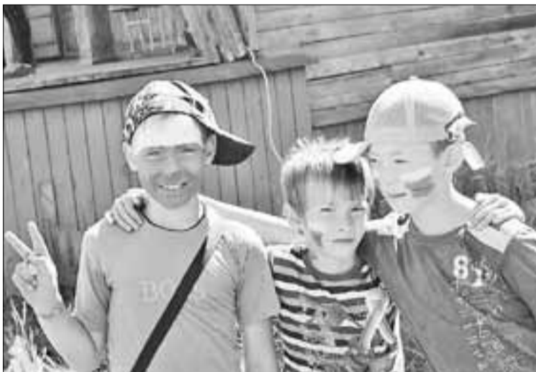
■ День России в Маймаксе