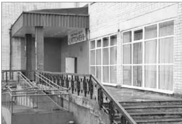
■ В КЦ «Цигломень» в преддверии его 75-летнего юбилея сделан ремонт

Строительство новых домов – острое требование времени. При их возведении в Цигломени применяются типовые проекты, кото-