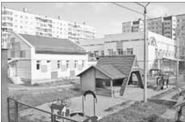
■ «Семицветик» – современный детсад с бассейном