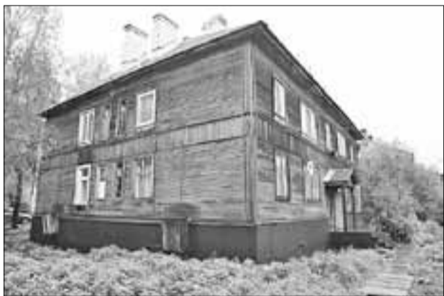
■ Дом на Мещерского, 30 в этом году был капитально отремонтирован