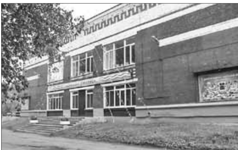
■ Перемены к лучшему коснулись и КЦ «Бакарица»

«Хоккейная коробка уже сертифицирована. Здесь есть даже отапливаемые раздевалки»