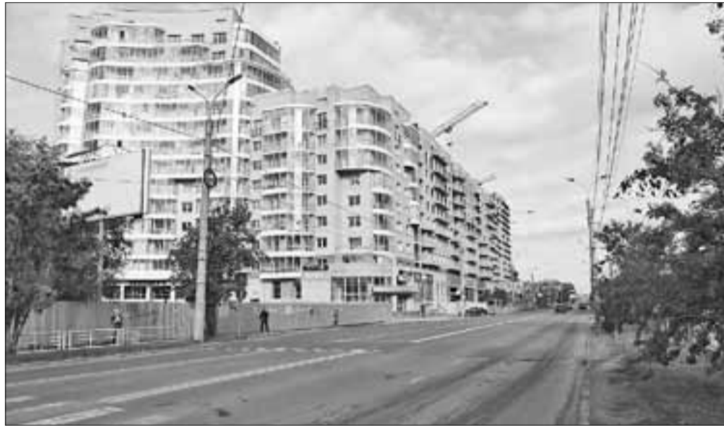
■ Улица Воскресенская меняет свой унылый наряд из деревянных домов на современные новостройки.

И будет выделять дальше. Это крайне важный фронт работ для города, в котором протяженность трасс составляет 540 километров, необходимо продолжение их строительства и ремонта. Не меньше внимания и дворам. Например, в прошлом году мэрия Архангельска нашла средства на их ремонт – 75 миллионов рублей. Было приведено в порядок 120 проездов по 47 адресам.