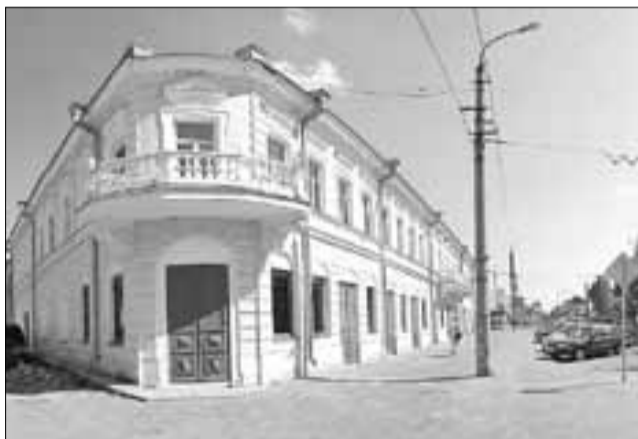
■ Старинные здания – настоящее украшение Архангельска

ческую экспозицию для познания, что называется, своих истоков. Градоначальник предложил создать здесь дом традиционной северной культуры со звучным названием «Ар-