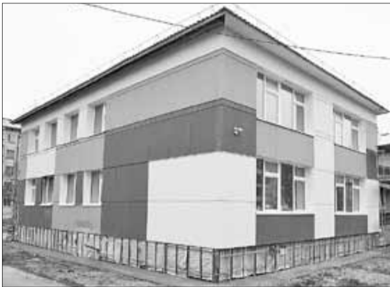
■ Детсад «Сиверко» скоро примет первых воспитанников

– В этом году мэрия и депутаты гордумы выделили 500 тысяч руб-