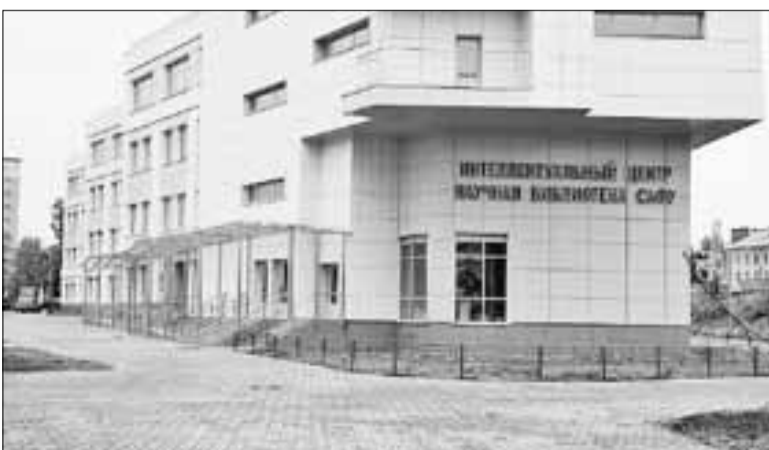
■ Библиотека САФУ станет научным и досуговым центром университетского города

Набережная на этом участке скоро будет полностью реконструирована. Здесь строится жилой комплекс, потом появится прогулочная зона и красивая часть набережной.