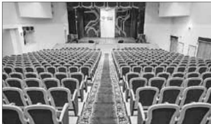
■ В большом зале АГКЦ обновили сцену и установили удобные современные кресла