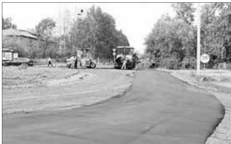
■ На улице Шабалина прошел большой дорожный ремонт