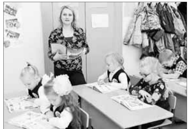
■ Талантливые учителя – гордость системы образования Архангельска

Также в ходе работы секции обсуждались вопросы творческой активности начинающих педагогов, проблемы воспитательной работы с классом, роли Всероссийской ассоциации молодых педагогов в системе образования.