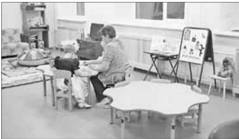
■ В Центре охраны прав детства для малышей созданы все условия